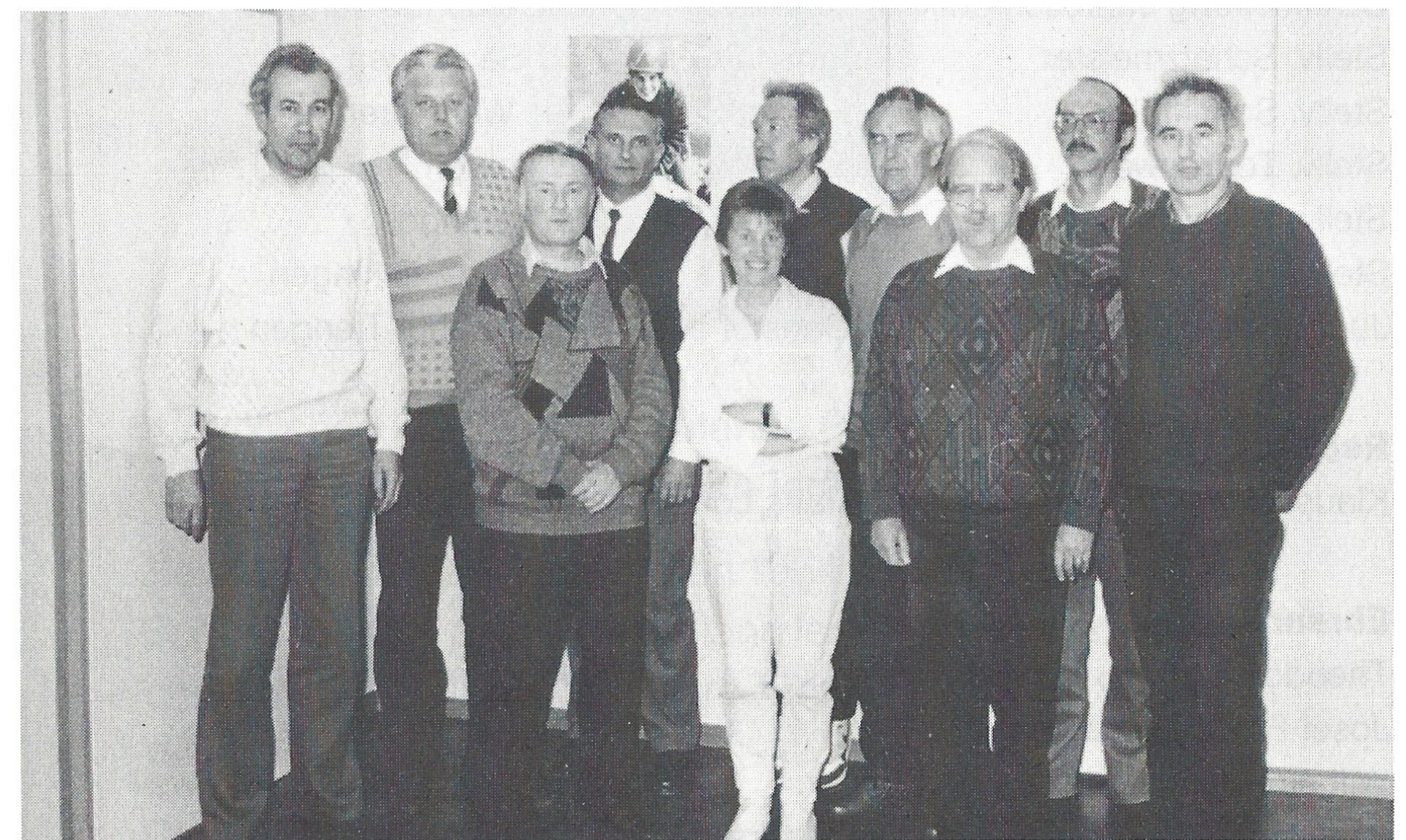
Der Vorstand — ohne den Jugendvertreter —

Nach der Ehrung von 13 Personen für eine 25-jährige Mitgliedschaft im DAV gab unser 1. Vorsitzender einen Ausblick auf das neue Vereinsjahr, erläuterte das bereits verteilte Jubiläumsprogramm und schloß die Versammlung mit guten Wünschen für das Tourenjahr 88.